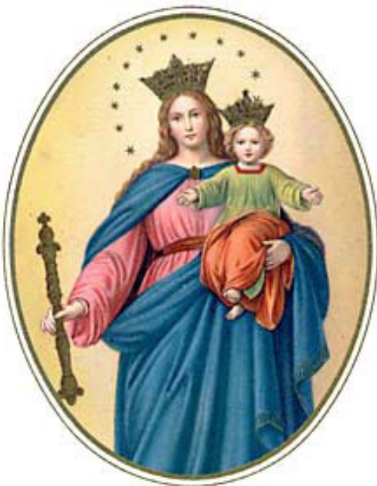
MARIA AUXILIUM CHRISTIANORUM ORA PRO NOBIS